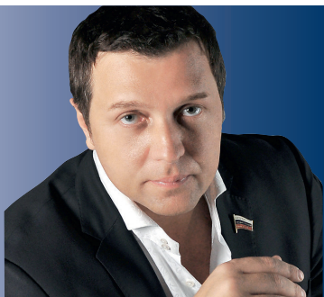
Заместитель Председателя Комитета Государственной Думы РФ по транспорту А.С. СТАРОВОЙТОВ

КОМИТЕТ ГОСУДАРСТВЕННОЙ ДУМЫ РФ ПО ТРАНСПОРТУ И МИНИСТЕРСТВО ТРАНСПОРТА РОССИЙСКОЙ ФЕДЕРАЦИИ